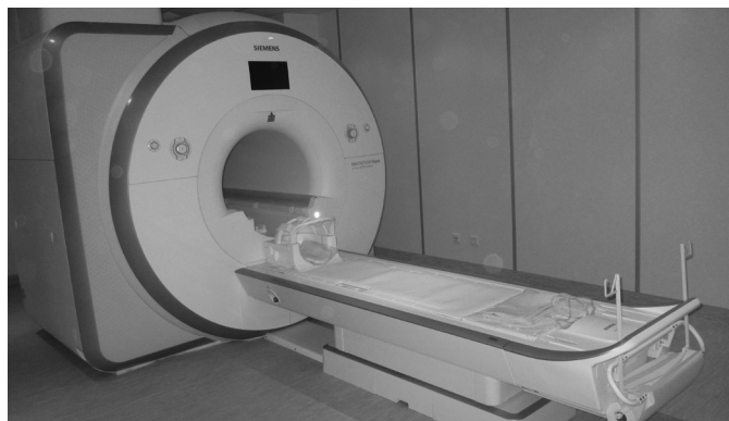
У ПОКЛ ім. М.В. Скліфософського встановлено один із двох в Україні найпотужніших МРТ-апаратів.

Під час участі у пілотному проєкті наша лікарня показала дуже хороші результати. Нова система фінансування дасть можливість заробляти більше коштів лікарням, які лікують більше пацієнтів, а не утримують порожні ліжка. Вимоги, які ставить НСЗУ перед лікарнями, є мінімальними. Якщо їх не виконувати, постає питання: чи має така лікарня право надавати медичну допомогу взагалі?