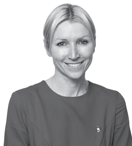
Оксана Мовчан, в. о. Голови Національної служби охорони здоров'я України

Сьогодні більшість медзакладів уже підписали договори з НСЗУ і готові виконувати їх умови. Вже понад 90% українських лікарів зареєструвалися в електронній системі охорони здоров'я. Електронні дані — основа для прийняття рішень. Завдяки інформації, яку керівники закладів подавали у своїх пропозиціях, у нас є дані які спеціалісти, яке обладнання та як організована медична допомога в конкретній лікарні. Ми знаємо, де є відділення інтенсивної терапії, реанімація, апарати ШВЛ. На основі цих даних НСЗУ дала свої пропозиції МОЗ стосовно лікарень, які можна задіяти у боротьбі з COVID-19.